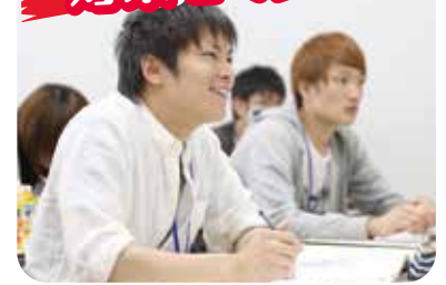
翌日の特別AO入試もこれでバッチリ! 不安を解消して当日を迎えよう!