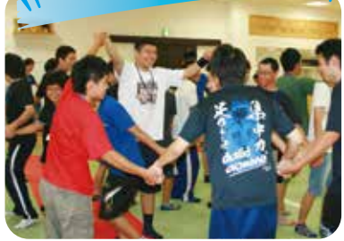
みんなで楽しく身体を動かしながら コミュニケーションを深めよう!!