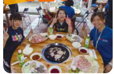
楽しい食事とイベントで たくさん友達を作ろう!!